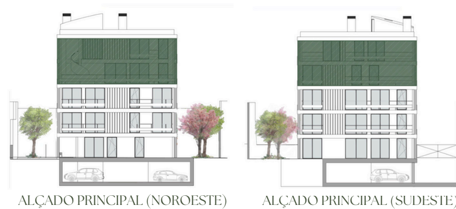
ALÇADO PRINCIPAL (NOROESTE)